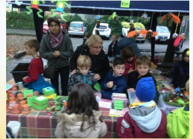
Erntedankfest - Markttag